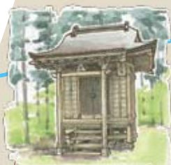
⑰ へそ神社 親子の絆・へその緒が おさめられています