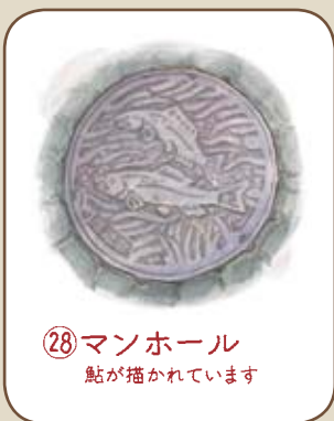
⑳ マンホール 鮎が描かれています