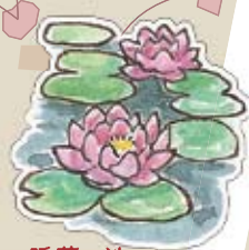
睡蓮の池 自然にできた急須形の木(ツゲ)が