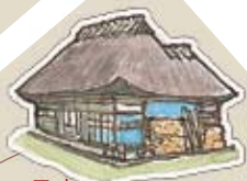
民家 現役のかやぶき屋根の家