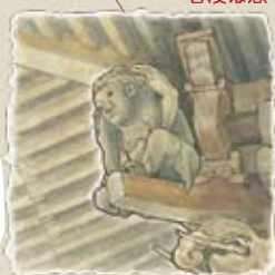
⑯ 岩見神社 屋根を支える力士は 色んな表情をしています