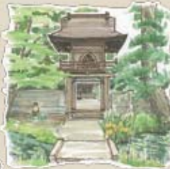
⑨満蔵寺 山門 山門前の池は 睡蓮がみごとです