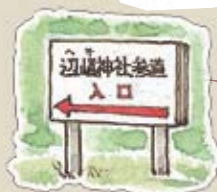
へそ神社看板 ひときわ目立つ看板