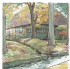
⑲ 鵜養の堰 ブクブク、ポコポコ どんな音がするかな