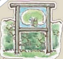
仁井田堰の看板 かえるがかわいい