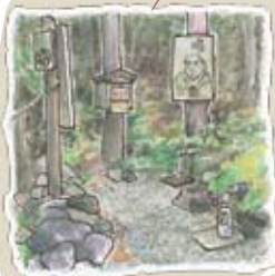
⑫戸島清水 一枚板の立派な看板が目印