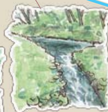
水路 鵜養集落につながっている水路