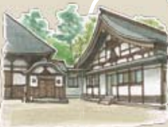
⑧満蔵寺 豊島城主ゆかりのお寺