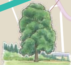
⑥豊島館の一本杉 遠くからでもよく見える?