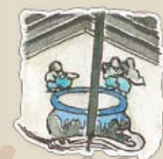
蔵の鰻絵 明治のはじめ頃の鰻絵