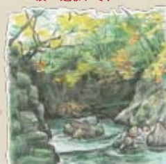
⑲ 殿淵 吸い込まれそう