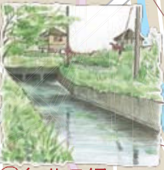
⑦仁井田堰 仁井田堰の出发点