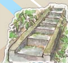
殿淵近くの階段 りっぱな階段