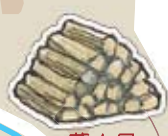
薪小屋 薪がびっしり