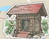
殿淵の祠 近くの清水はイボに効くそうです