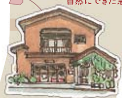
田口商店 食品・雑貨はおまかせ。 ここでごはんばっています。