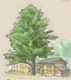
㉕ もみの木 市指定天然記念物 樹齢360年以上