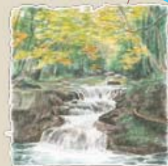
⑱ 伏伸 天気によっては激しい流れ