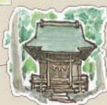
岩見神社 石段は急でおっかなびっくり