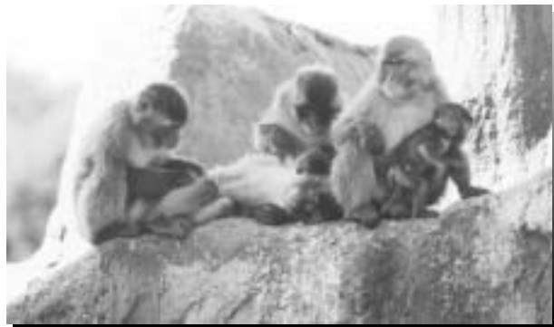
▲サル山の二ホンザル

ところで、飽くなき挑戦者たちが袋小路に入らず、頑なに基本的スタイルを守り続けてきたことは、結果的に今の私たち人への進化に結びついたわけであるが、このことは人間という極めて頭でっかちで特異な動物を創り上げてしまったというパラドックス的展開をも生み出したのである。嗚呼、挑戦者たちは何処へと向かうのであろうか。