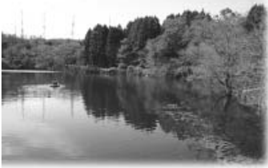
▲大森山山頂を望む調査地塩曳潟

現在、動物園が取り組むべき自然環境保護は、展示動物を通しての多様な自然環境の重要性を訴えるだけではなく、種の保存等に結びつくような、より具体的な活動が求められています。今回は、園内にある塩曳潟の水生物調査を通して、自然環境の保護について考えてみました。