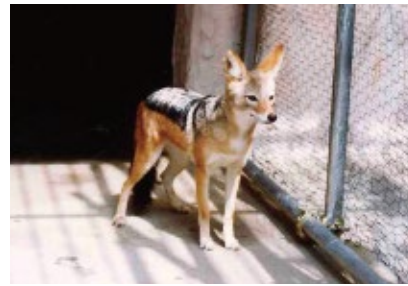
セグロジャッカル