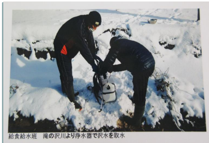
給食給水班 滝の沢川より浄水器で沢水を取水