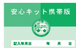
安心キット携帯版