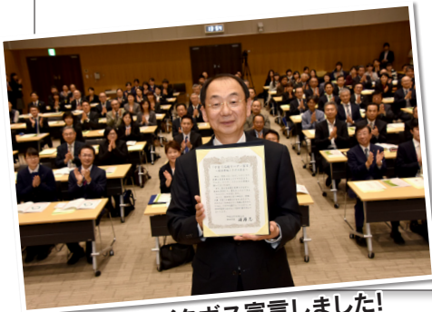
市長もイクボス宣言しました!