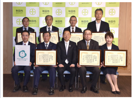
平成28年度受賞企業の皆様と市長

株式会社 秋田ケーブルテレビ 秋田県信用組合 伊藤工業 株式会社 医療法人杏仁会 御所野ひかりクリニック