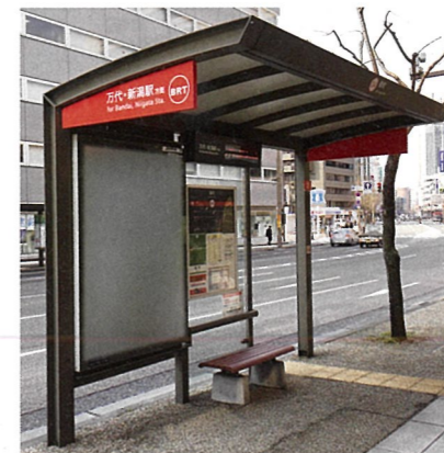
■タイプ2:既存施設活用