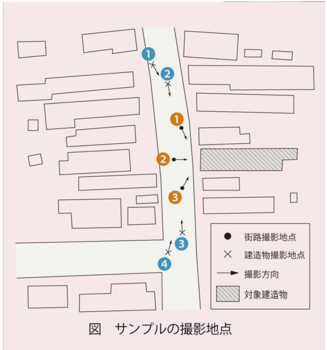
図 サンプルの撮影地点