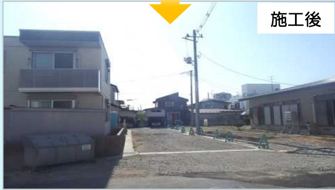
▶ 道路を新設しました (区画道路6-33号線/幅員6m)