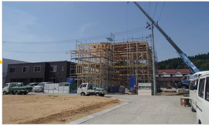
▶ 道路を拡幅しました (区画道路6-67号線/幅員6m)