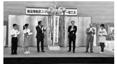
飯島南地区コミュニティセンター竣工式典でのくす玉割り