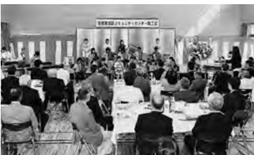
飯島南小学校器楽部による演奏が式を盛り上げました