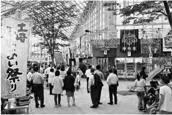
6月30日、セリオンリスタで行われた、イルミネーション点灯式&コンテストで

これは、「明るく綺麗な街づくり」を目的に、今回で4年目となる秋田みなと振興会が行っている事業で、毎年、土崎周辺の企業などが工夫を凝らしたイルミネ