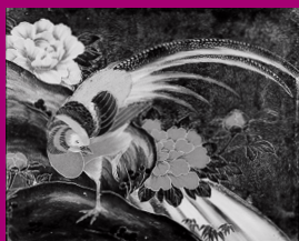
「花鳥」(長崎系ガラス絵)