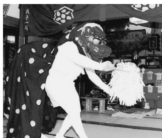
「瀧保八幡神社神楽」 (由利本荘市西目町)

秋田城跡から今年度発掘された、古代の暦を記した漆紙文書を赤外線カメラを使って解説するほか、解読体験も行います。入館料200円(高校生以下無料)。