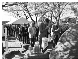
10月21日、武雄市市民訪問団をはじめ、たきも出席が地域のみなさん慰霊祭が行われました

葉隠墓苑に関する問い合わせは、西部市民サービスセンターへ。☎(0888)8080