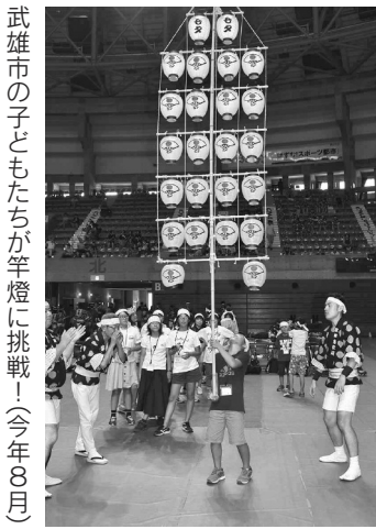
武雄市の子どもたちが竿燈に挑戦！(今年8月)