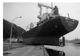
震災直後の岩手県釜石市

地域の防災に関心があり、リーダーとしての活動をめざすかたを対象に、「自主防災リーダー研修会」を開催します。