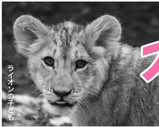
ライオンの子ども