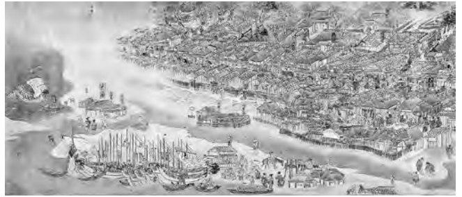
県指定文化財「秋田街道絵巻」伝 荻津勝孝(上巻・土崎湊部分) 千秋美術館所蔵