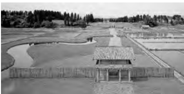
弘田柵跡 (写真提供=大仙市教育委員会)