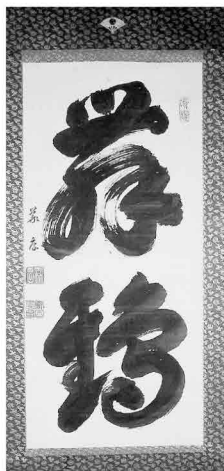
書「舞鶴」佐竹義厚筆