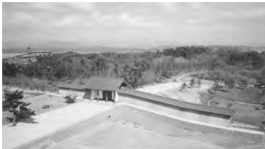
秋田城跡外郭東門