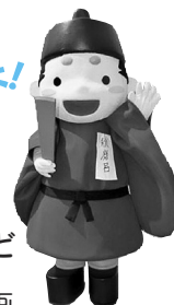
マスコットの秋麻呂くん

は当日の抽選です。申し込みは、9月10日(火)8:30から東門ふれあいデー実行委員会(秋田城跡歴史資料館内)へどうぞ。