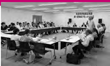
中央地域の協議の様子

すでに地域代表や保護者の代表からなる協議会で、学校統合の方向性(学校の組み合わせ)について話し合いを行っており、第3回協議会を次の日程で開催します。協議会の傍聴