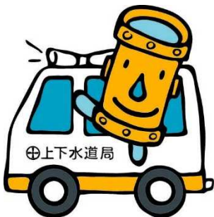
秋田市上下水道局 マスコットキャラクター 「カンちゃん」

上下水道局の人と一緒に、 ラジオの収録にも行ってきたよ！ 緊張したけど、水道週間について たくさんPRできたよ！