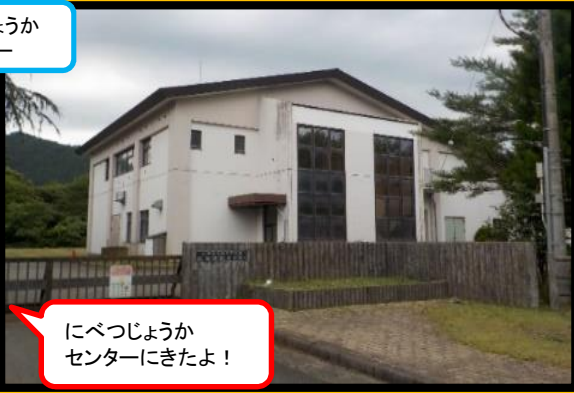
にべつじょうか センター