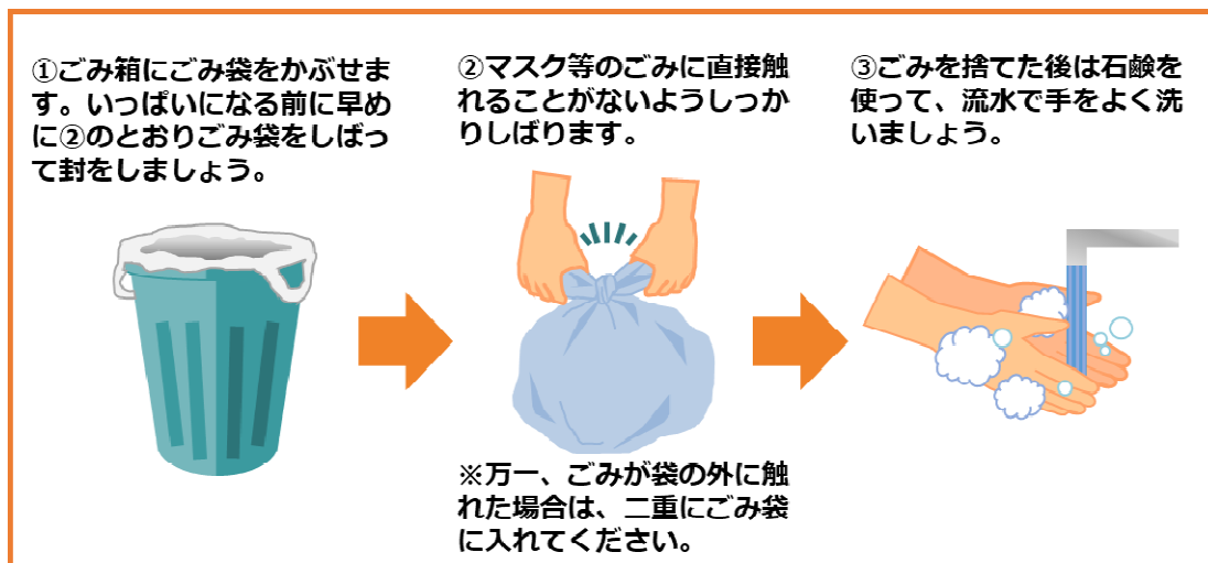
図1 新型コロナウイルス等の感染症の感染者又はその疑いのある方の 使用済みマスク等の捨て方(環境省)