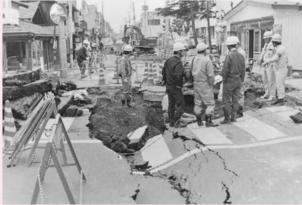
日本海中部地震の様子。大町地区

昭和58(1983)年5月26日に発生した「日本海中部地震」では、県内でも津波が発生し、多くの犠牲者が出ました。その教訓を忘れないようにと、5月26日を「県民防災の日」と定め、さまざまな啓発を行っています。