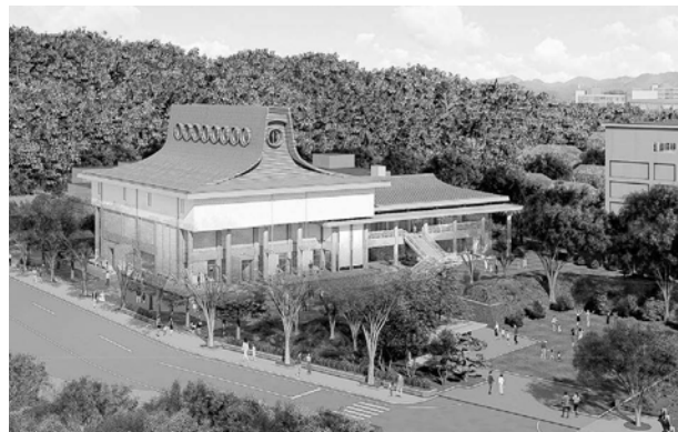
秋田市文化創造館完成図