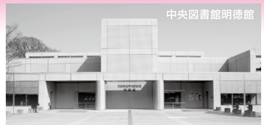
中央図書館明徳館