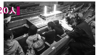
いい音出てるかな~?

小学生と保護者が対象です。普段みることができない文化会館の舞台裏見学や、音響装置・照明機器の操作などを体験！ 申し込み▶12月21日(月)9:00から文化会館☎(865)1191