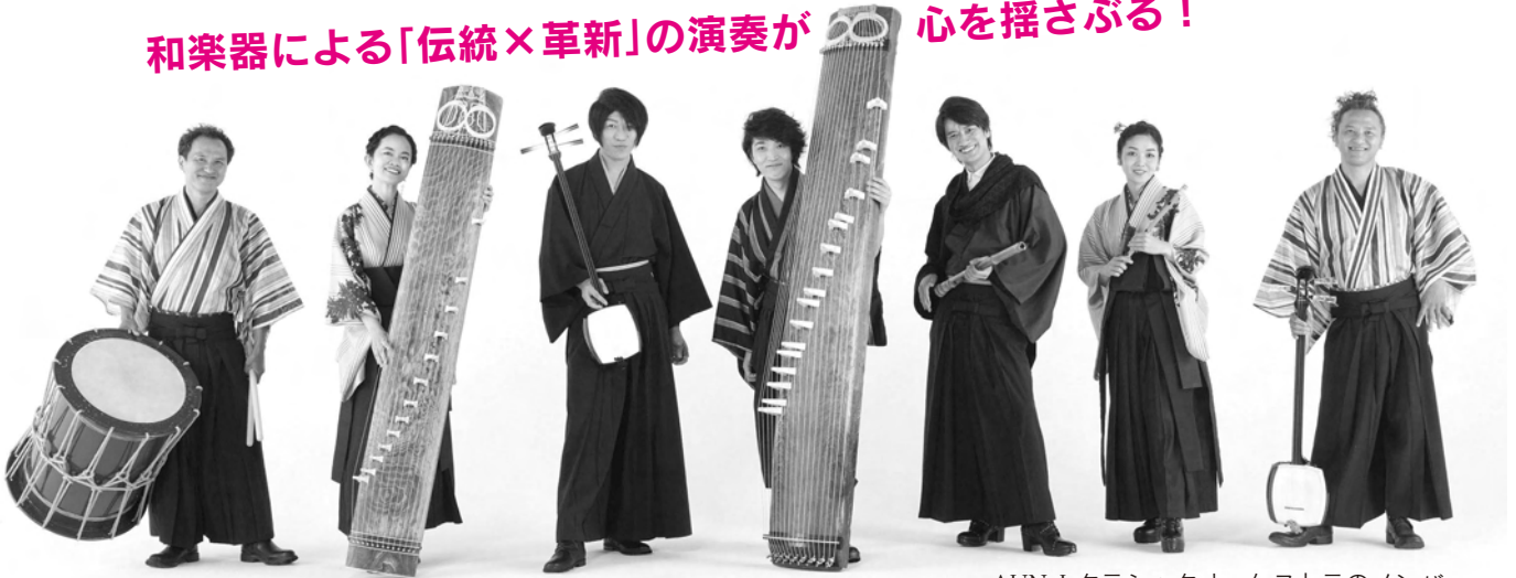
AUN J クラシックオーケストラのメンバー