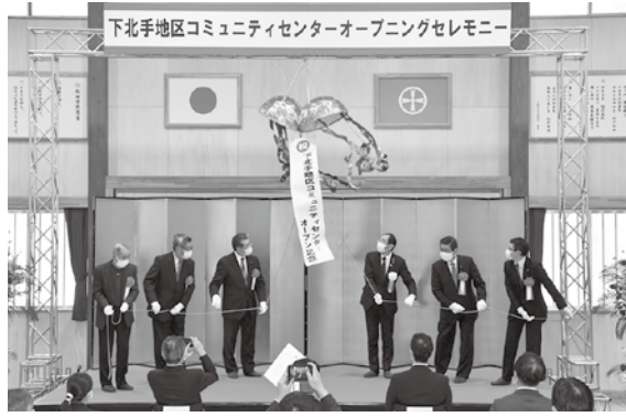
くす玉を割って完成をお祝いました！