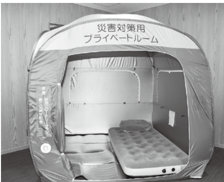
感染防止になり、プライベートもしっかり確保できます