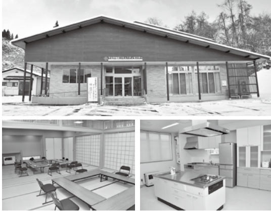
延べ面積は524.6平方メートルです。 写真右下は調理室、左は和室