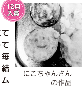
12月入賞 にこちゃんさんの作品

身のまわりにあるものを笑顔に見立てた写真を撮ってみませんか。毎月選考の上、結果を市ホームページなどで発表