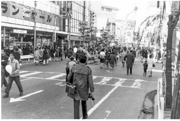
昭和を感じます！ かつての広小路歩行者天国(昭和45年)