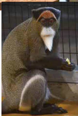
ブラッサグエノン