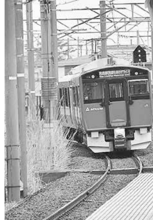
下り線のホームから