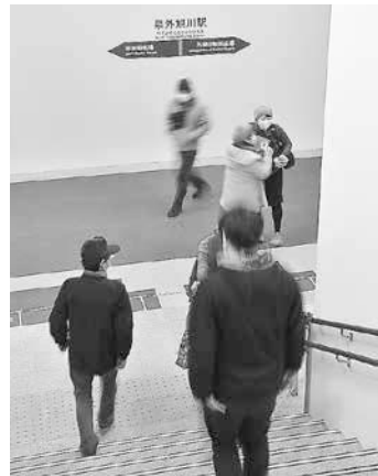
地下道の採光もバッチリ