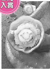
花ヨヨーさんの作品

などで発表するほか、入賞者には 秋田市家族・地域の絆づくりキャ ラクター「テッテ」のプチぬいぐる みを差し上げます。詳しくは、市 ホームページをご覧ください。