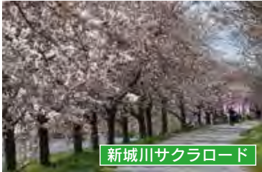
新城川サクラロード