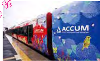
男鹿線沿線に咲く季節の花々がラッピング。中吊りにもお花