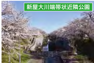
新屋大川端带状近隣公園