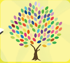
↑完成イメージ 皆さんのイラストが1つのアートに!