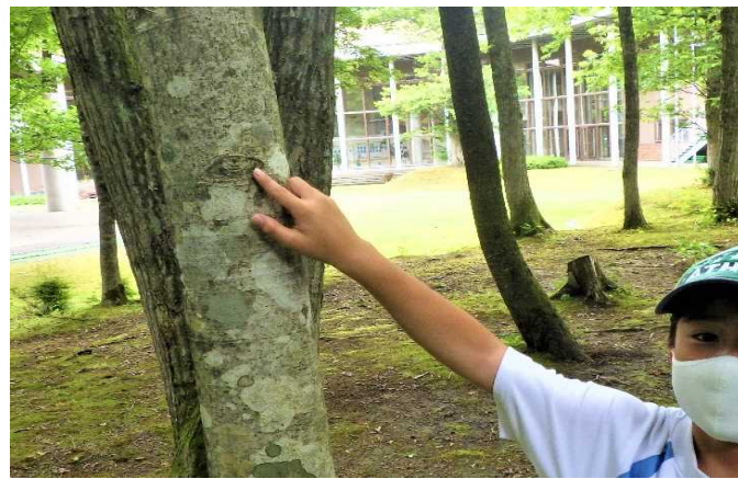
幹に「目」がある木を発見! お気に入りの木、見つけることができたね!