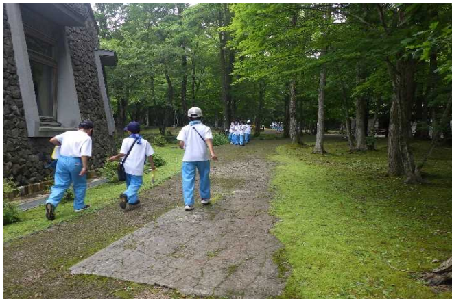
ビンゴカードをもって出発!