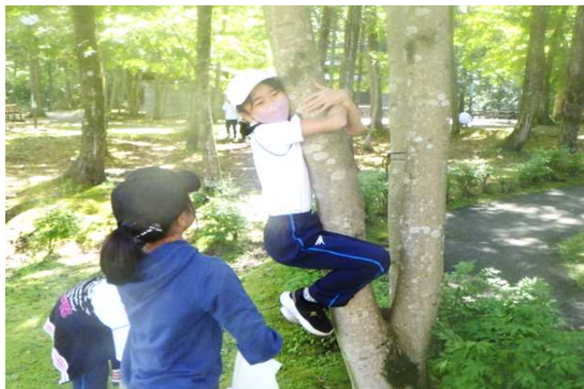
木に3秒だきつくミッション。 自分に合う太さの木を選ぶのがポイント。