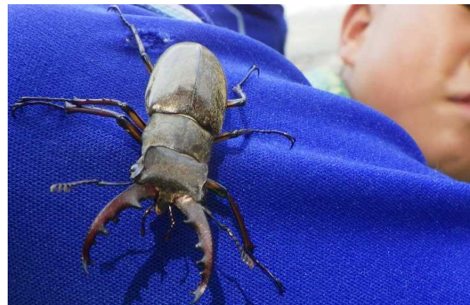
ミヤマクワガタに会えた。 季節によって出会える生き物もさまざま。