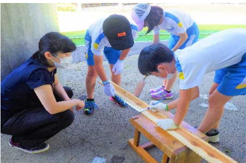
● 差し金を板にあてて、29cmずつ長さを測り、鉛筆で線を引く。