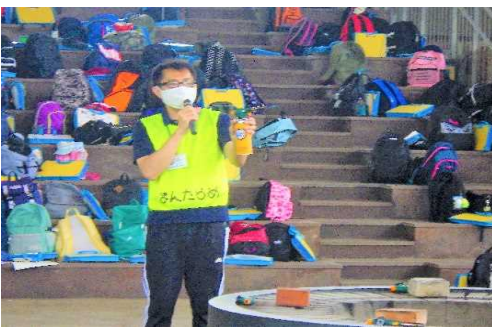
● ガスバーナーの操作方法をきき、火傷を未然に防ぐ。