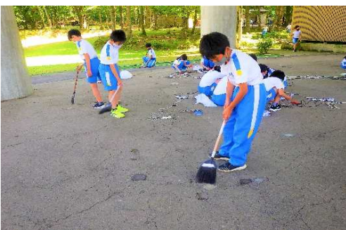
【共通】 使い終わった場所は、みんなできれいに掃除する。