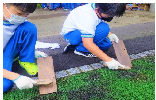
● 人工芝の上で板を金ブラシでこすり、木目に沿って下にすすを落とす。