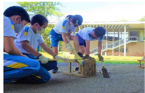
● 両刃のこぎりは目の細かい方で切る。グループで支え合い、協力する。