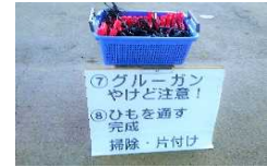
【共通】 手順や注意点をボードで確かめながら作業を進める。