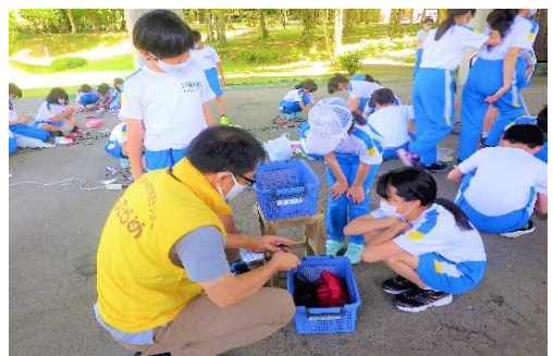
【共通】 使い終わった道具も、きれいにそろえて整とんする。