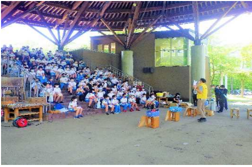
【共通】 手順や安全面の配慮を確認する。