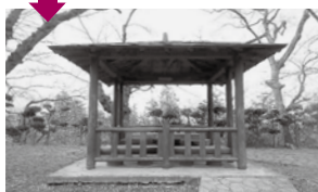
完成後、ピカピカに♪