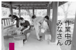
作業中のみなさん

今年度は、昨年10月に千秋公園本丸のあずまやとトイレの塗装をしていただきました。ありがとうございました。