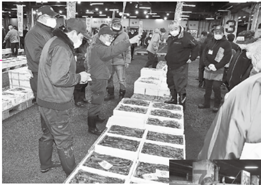
水産物部での競りの様子。今年も新鮮なお魚がズラリ！

卸売業者のみなさんのほか、来賓や市場関係者が、水産物部・青果部・花き部と順に会場を移動しながら、手締めなどを行い、今年1年の商売繁盛を願いました。