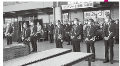
花き部での初せり式