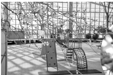
紅梅のほかにも、例年は、白梅、シダレウメなども見られます