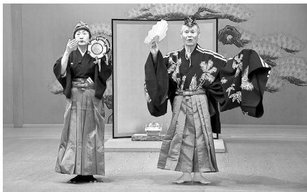
会員それぞれの「味わいある、演目を楽しめました