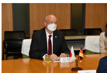
駐日ドイツ連邦共和国大使