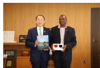
駐日ボツワナ共和国大使