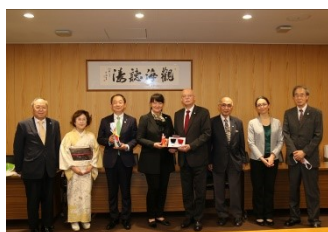
ドイツ連邦共和国大使館と秋田日独協会の皆さま