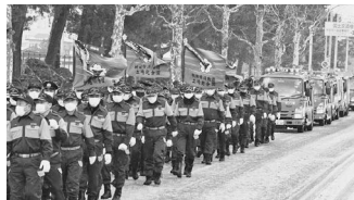
1月5日の消防出初式で。整然と行進する各地域の消防団のみなさん