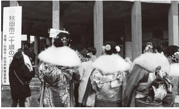
二十歳のつどい(1月8日)