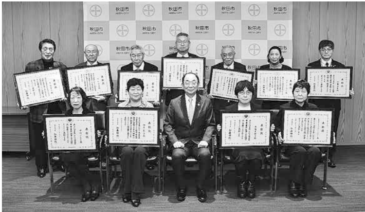
1月19日の表彰状伝達式に出席されたみなさん