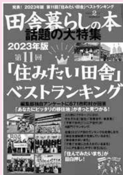
宝島社「田舎暮らしの本」2月号

移住定住の推進に積極的な自治体を対象に、移住支援策、医療、子育て、自然環境、就労支援、移住者数などを調査し、その回答を基に田舎暮らしの魅力を数値化し、ランキング形式で紹介する『「住みたい田舎」ベストランキング』において、次の6部門で1位を獲得しました。