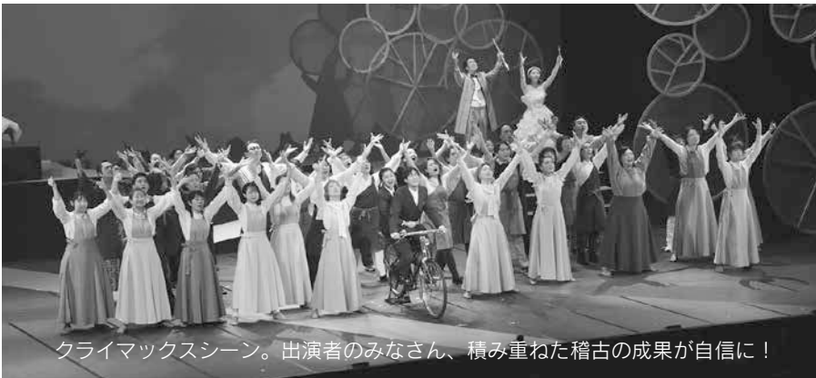
クライマックスシーン。出演者のみなさん、積み重ねた稽古の成果が自信に！

作品は、3代にわたる県民会館に親しんできた家族を主役にして、明治の頃から現在に至るまでの社会情勢や市内で起きた出来事を追いかけてながら、時代を彩った歌謡曲なども散りばめられたストーリー。秋田の人には馴染み深い場所がセリフに盛り込まれたり、ゆかりのある人物が登場