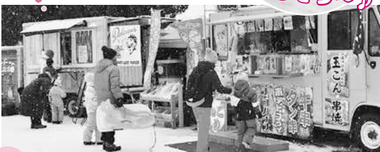
雪の動物園は土日・祝日開催(2月26日まで)