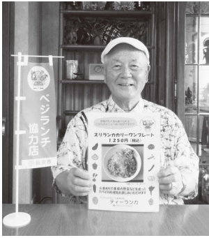
協力店の「ティールンカ」(山王)