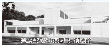
完成間近の中央図書館明德館