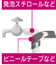
発泡スチロールなど ビニールテープなど

露出している部分を布きれや発泡スチロールなどで覆い、濡れないようにその上からビニールテープで巻きましょう。