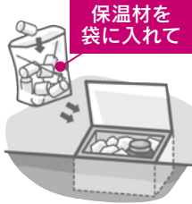
保温材を袋に入れて

保温材を入れましょう 発泡スチロールなどを細かく砕いて、濡れないようにビニール袋に入れ、メーターを覆うように包みましょう。