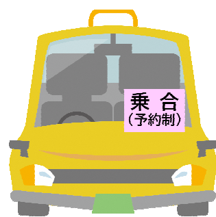
ピンクの表示が目印です

※バスのように予約時間になれば出発します。一般タクシーとは違いますのでご注意ください。 ※車椅子でのご利用は予約センターにお問い合わせください。