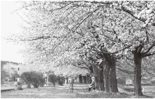
桜の下で、お茶っこ飲んでちょっと息抜き(写真は昨年のももの)