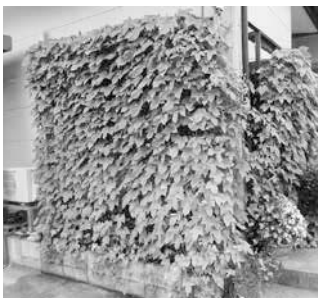
過去の写真展応募作品