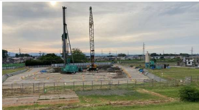
ポンプ場全景（杭打工事（順調））