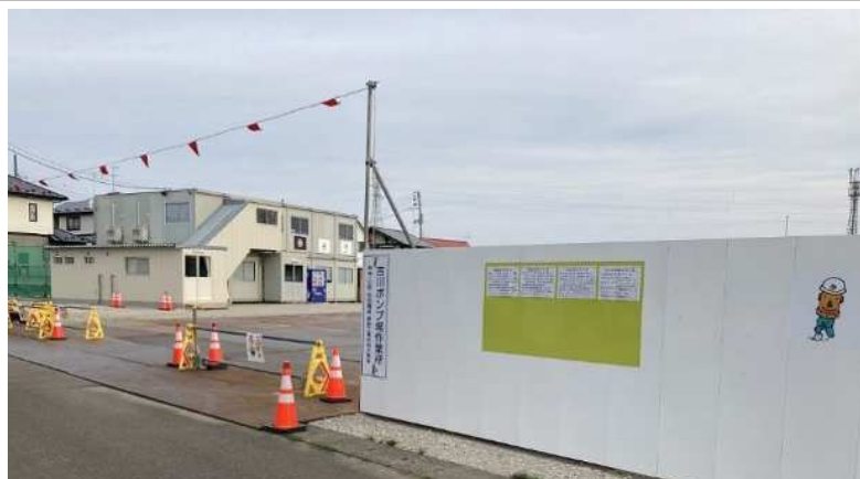
現場事務所設置（やっと落ち着きました）