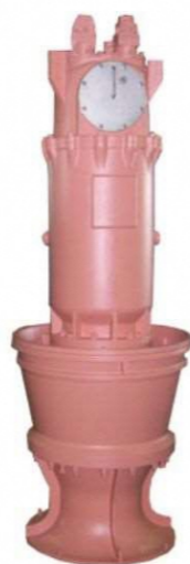
コラム型水中ポンプ (イメージ図)