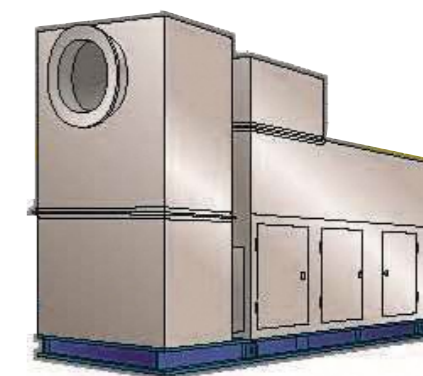
ガスタービン発電機 (イメージ図)