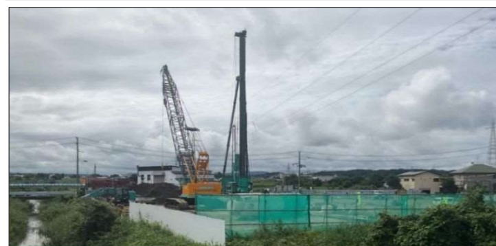
引込施設全景（杭打ち工事）

建設工事：引込施設・ポンプ場（基礎・躯体）・吐出水槽・乗り越し管 熊谷・山岡・秋田舗道建設工事共同企業体 工期：令和6年1月29日～令和8年3月23日