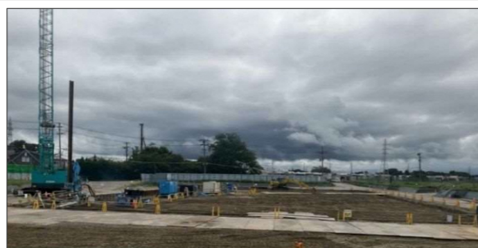
ポンプ場全景(土留工事)