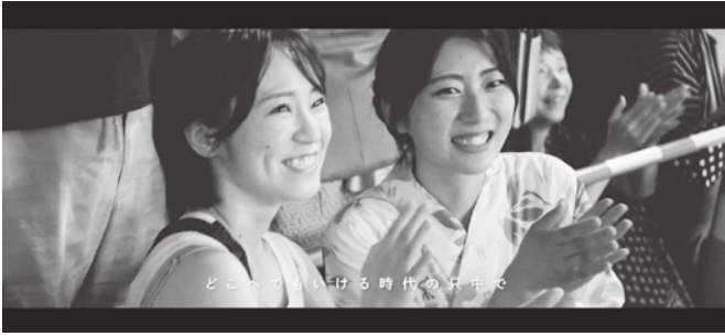
「久しぶりに、帰ることになった。AKITA CITY PROMOTION」の一場面。動画は秋田市公式YouTubeで見るができます