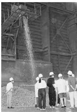
バイオマス発電所で

修が行われたほか、2日目以降は普段入ることができない風力発電所や、乾燥した木質チップを使ったバイオマス発電所を見学するなど、秋田市のさまざまな新エネルギー関連産業の「今」を体感しました。