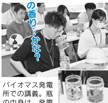
バイオマス発電所での講義。瓶の中身は、発電に使われる燃料(秋田杉のチップとパームヤシの殻)

市では今後も事業PRを通して、新エネルギーへの理解を深めてもらう取り組みを行うこととしています。秋田市の新エネルギー政策の方向性を定めた「秋田市新エネルギービジョン」は市ホームページでご覧いただけます。 ◆広報ID番号 1040978 ☎(888)5743