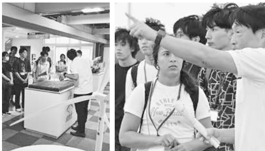
実践的な説明に真剣なまなざしのみなさん