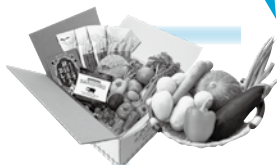
写真は景品のイメージです

「秋田市地産地消推進店」を利用すると、秋田市産品詰め合わせセット(3,000円～10,000円分)が合計17人に当たるキャンペーンを開催中！応募締切は11月30日(土)。