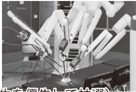
手術支援ロボット ダウインチ

☎(823)4171 Eメール ro-homn@akita-city-hospital.jp