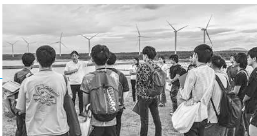
飯島サンセットパークで洋上風力発電を見学

国にさきがけて、洋上風力発電事業が展開され、関連産業の振興に取り組んでいる秋田市。今回、洋上風力発電などの新エネルギー関連産業を「見て、聞いて・感じて」将来の進路選択につなげてもらおうと、市内の大学生などを対象に8月26日から29日までの4日間「あきた新エネルギーカレッジ」を開催しました。 初日から、風車の上での高所作業を想定した訓練を体験するなど、講義だけではなく実践的な研