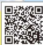
移住相談八重洲センター