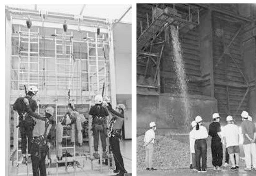
高所作業訓練も体験