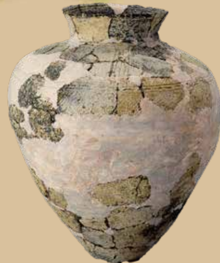
地蔵田遺跡 4号住居跡出土遺物

これを記念し本企画展では、普段は公開していない遺物を展示するとともに、史跡指定までの経緯をご紹介します。地蔵田遺跡を発見し、未来へ残そうとした当時の人々の思いに触れてみませんか。