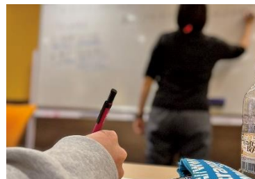
講座訓練(ライフスキル)