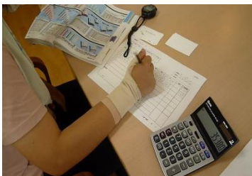
事務作業(物品請求)