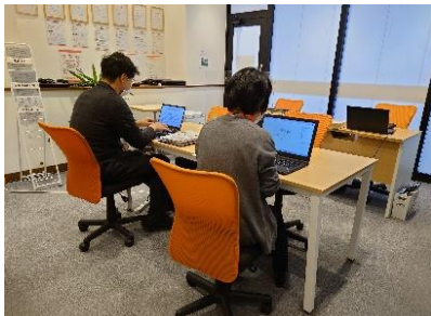
実践訓練(ワークスキル)