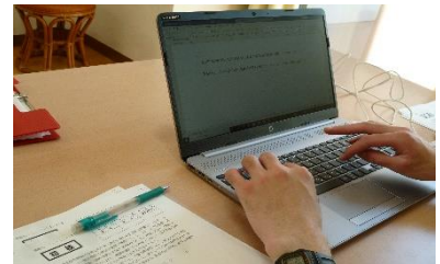
パソコン作業(作業風景)